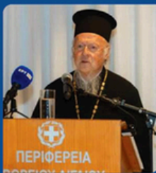
His All Holiness the Ecumenical Patriarch Bartholomew I

Αισθανόμαστε υπερήφανοι για την μοναδικότητα και το Διεθνές αποτύπωμα αυτής της Διοργάνωσης, που θα μπορούσε να χαρακτηριστεί "Υβριδική" με διαλέξεις υψηλού επιπέδου, πολιτιστικές αναδρομές, παρουσιάσεις σύγχρονων θεμάτων, απονομών τιμής σε προσωπικότητες με παγκόσμιο αποτύπωμα, παραστατικές τέχνες, μουσικές εκδηλώσεις, εκθέσεις, εναλλακτικές δραστηριότητες, ανάδειξη της ιδιαίτερης τοπικής παράδοσης, αλλά και της τοπικής γαστρονομίας σε μια δημιουργική συνεύρεση.