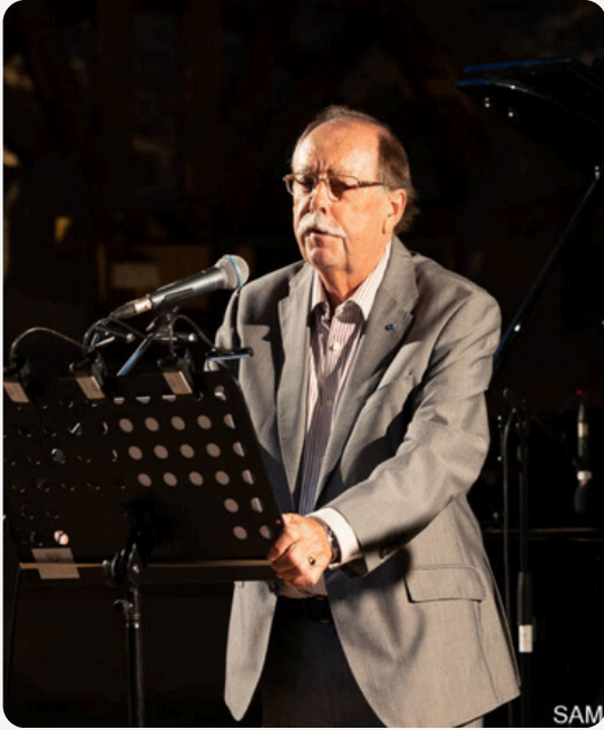
SIR RODERICK BEATON