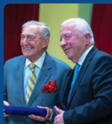
Rahmi Koc Entrepreneur