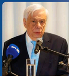
H.E. prof. Prokopios Pavlopoulos f. President of the Hellenic Republic