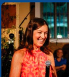
Victoria Hislop Novelist