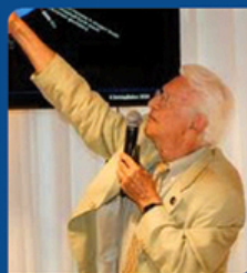
Stamatis Krimigis President of the Academy of Athens