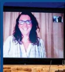
Bettany Hughes Historian, BBC Producer