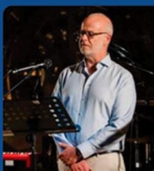
George Windsor , Earl of the St Andrews Chancellor of Bolton University