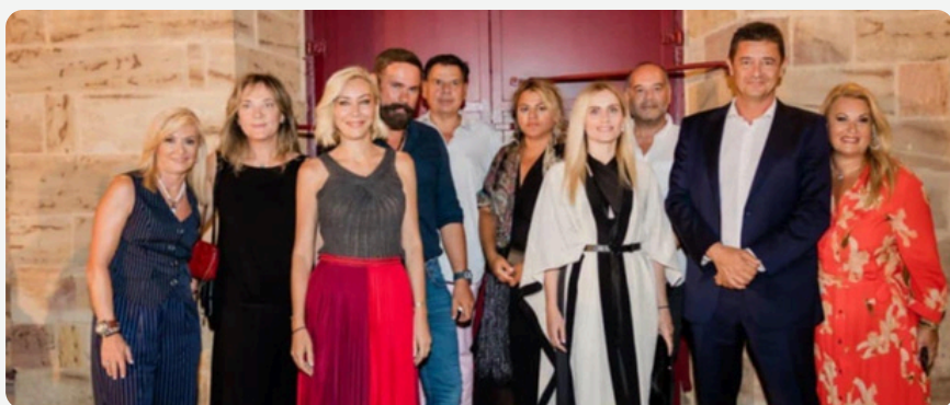
ΔΗΜΟΣΙΟΓΡΑΦΙΚΗ ΟΜΑΔΑ THE CHIOS FESTIVAL

Περισσότερα για τους προσκεκλημένους μας εδώ