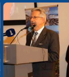
Kyriakos Kouros The Cyprus High Commissioner