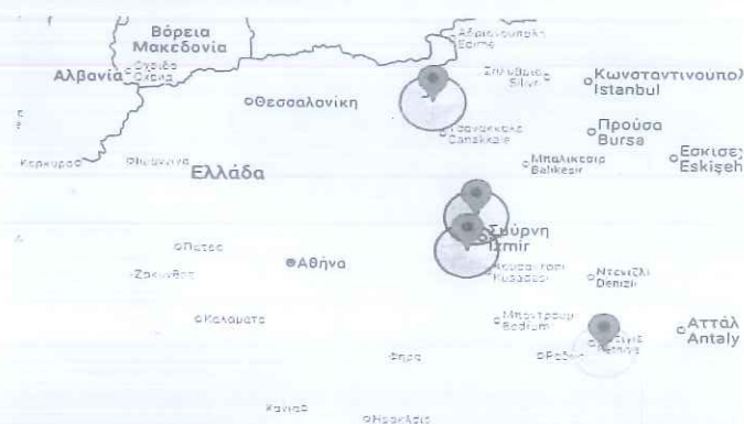
Εικόνα 1 Εστίες Αφθώδους Πυρετού στην Τουρκία στις περιοχές Mugla, Izmir και Edirne.

Λόγω της εγγύτητας των εστιών και με σκοπό την αποτροπή εισόδου του νοσήματος στη χώρα, οι κτηνιατρικές υπηρεσίες της Περιφέρειας Βορείου Αιγαίου εφαρμόζουν τα προβλεπόμενα της κείμενης νομοθεσίας του Σχεδίου Έκτακτης Ανάγκης για τον Αφθώδη Πυρετό (Αριθμ. 258618/17-03-2008, ΦΕΚ Β' 451) και καλούν τις αρμόδιες αρχές, τους κτηνοτρόφους και τους επαγγελματίες του κλάδου να εφαρμόσουν αυστηρά τα προβλεπόμενα μέτρα βιοασφάλειας.